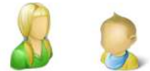
die Cousine – der Cousin