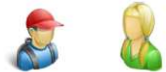
der Bruder – die Schwester