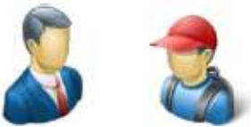
der Vater – der Sohn