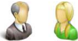
der Opa – die Enkelin