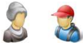
die Oma – der Enkel