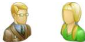
der Onkel – die Nichte