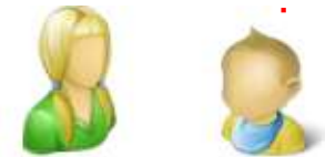
die Cousine – der Cousin