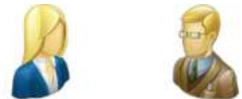
die Schwägerin – der Schwager