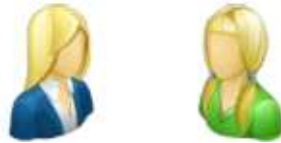
die Mutter – die Tochter