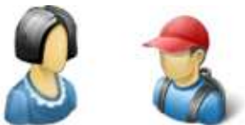
die Tante – der Neffe