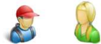
der Bruder – die Schwester